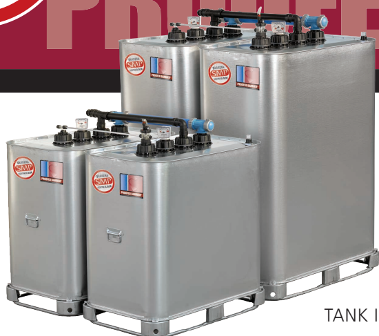
TANK IN TANK